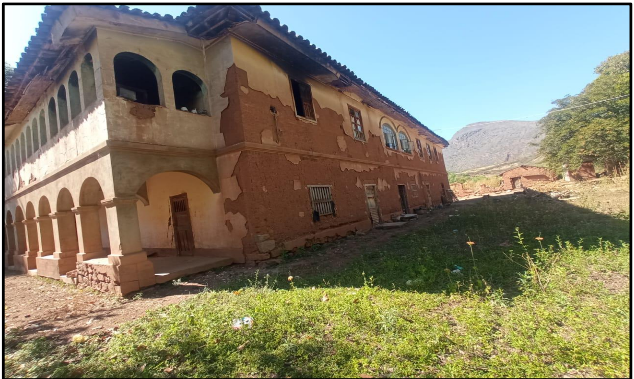
Fotografía N° 14: Casa hacienda de Magnupampa