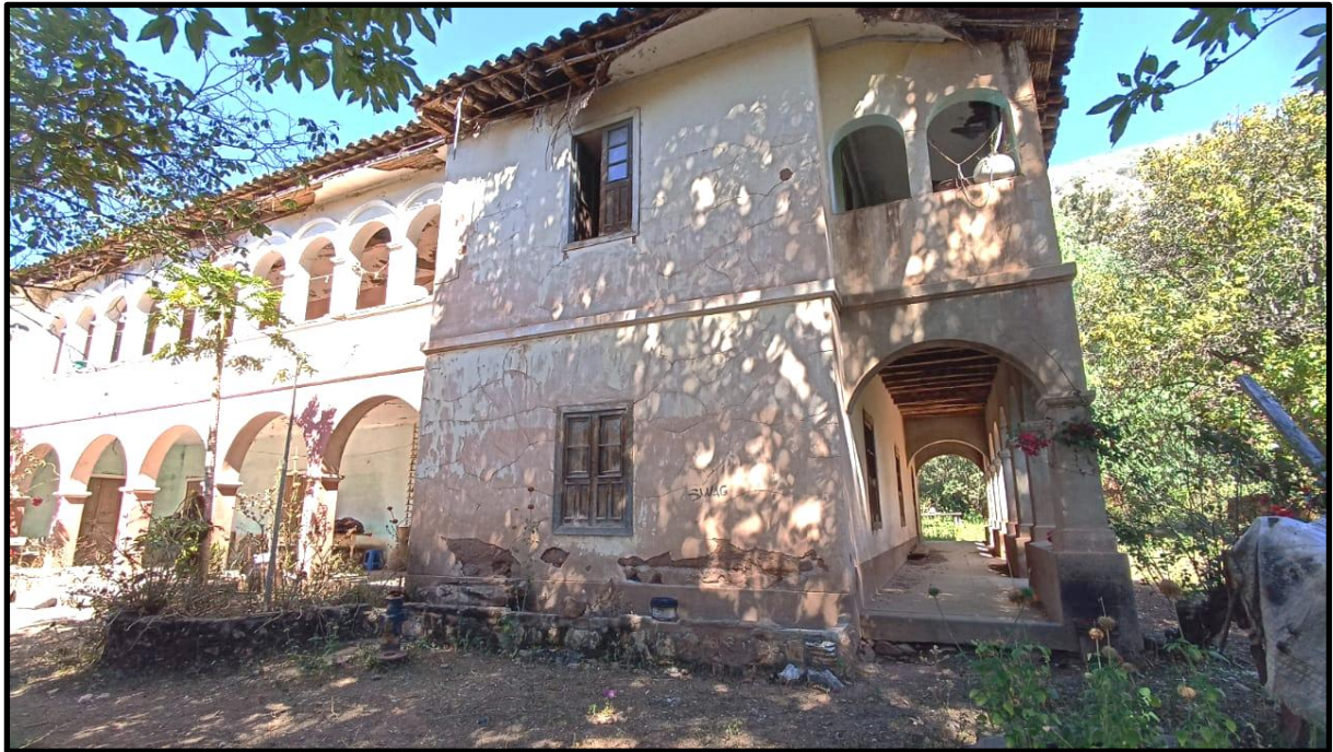
Figura 1: La actual situación de la casa hacienda.

Nota. Fotografía tomada por los autores con permiso de la propietaria actual (2025).