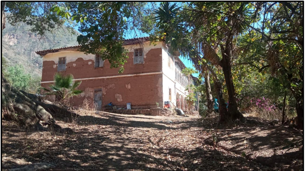
Fotografía N° 20: Casa hacienda de Magnupampa