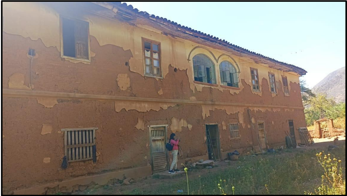
Fotografía N° 13: Casa hacienda de Magnupampa