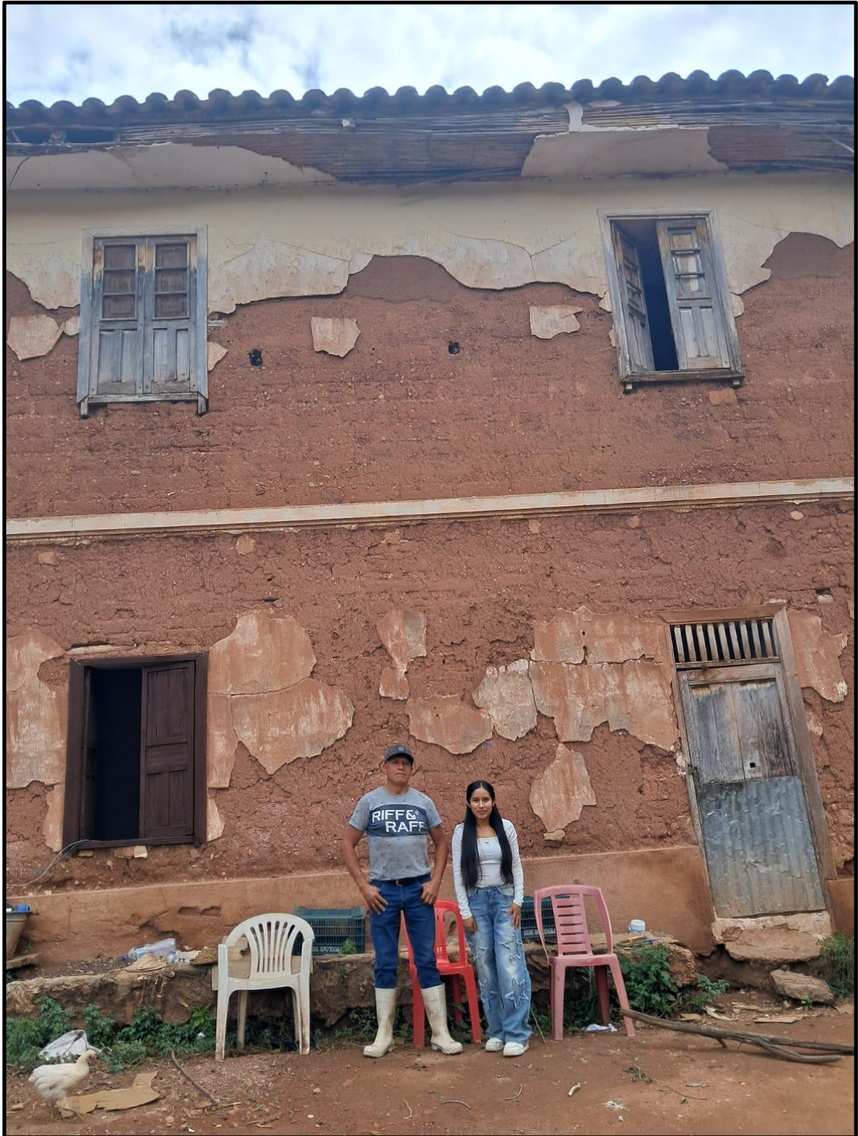
Fotografía N° 28: Conversando con el hijo de la dueña de la casa hacienda de Magnupampa