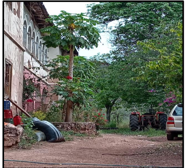
Fotografía N° 8: Primera visita a la casa hacienda