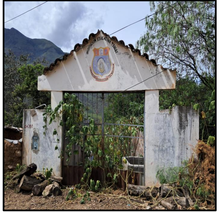
Fotografía N° 6: Ex escuela de Magnupampa