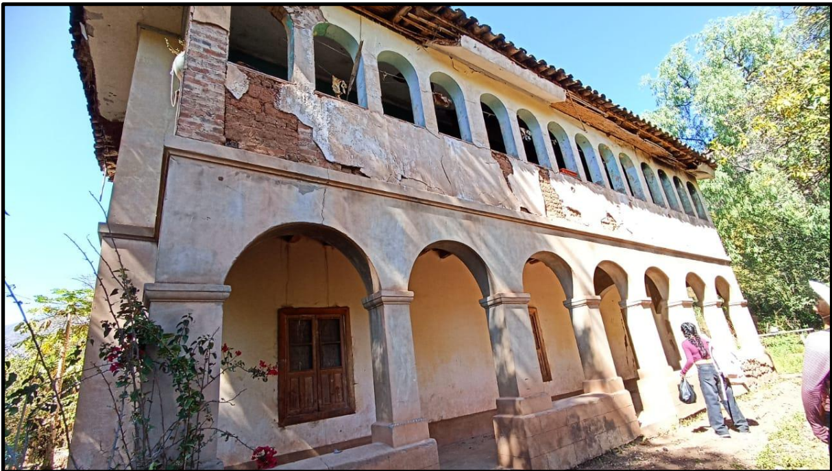
Fotografía N° 10: Casa hacienda de Magnupampa