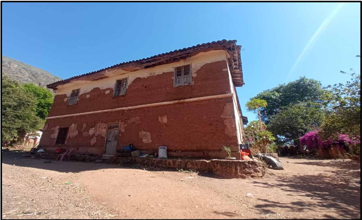
Fotografía N° 21: Casa hacienda de Magnupampa