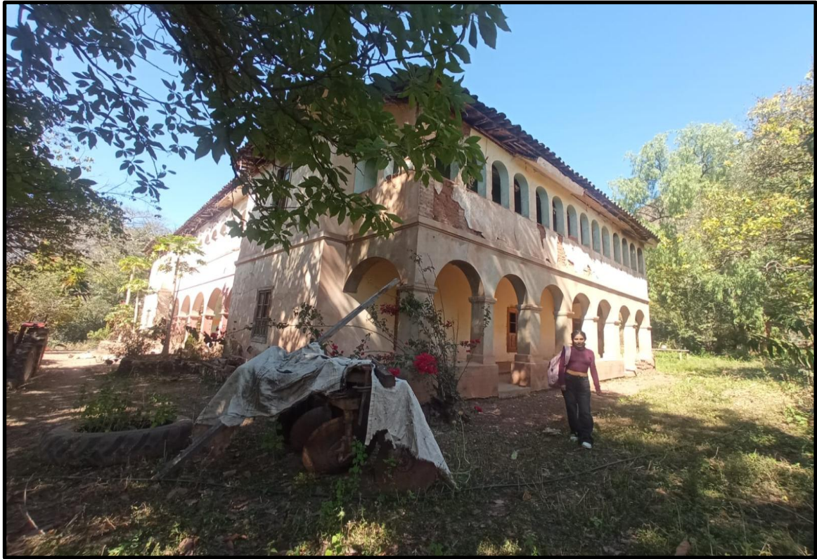
Fotografía N° 11: Casa hacienda de Magnupampa