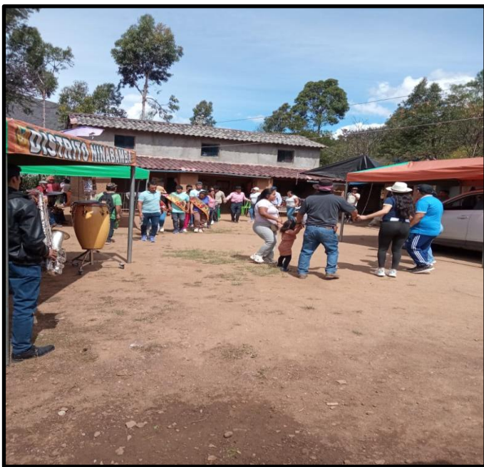
Fotografía N° 3: Conviviendo con las personas de la comunidad d Magnupampa