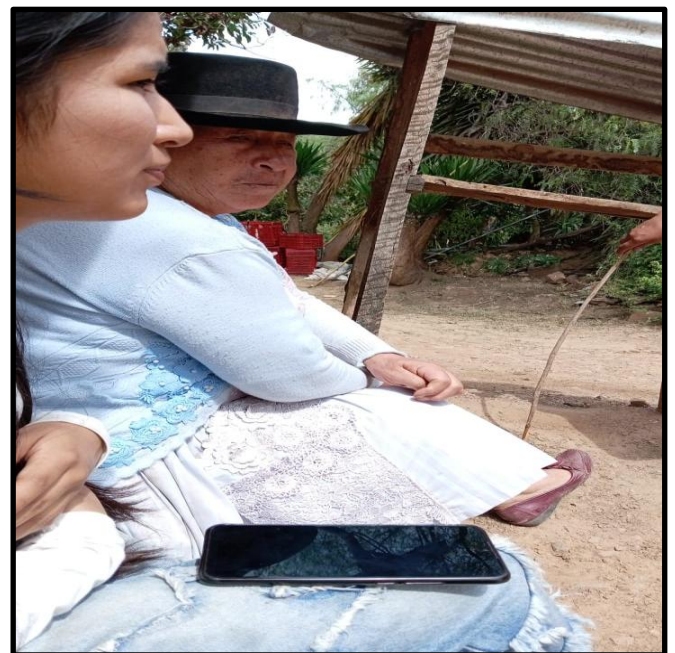
Fotografía N° 4: Conversando con una residente de la localidad