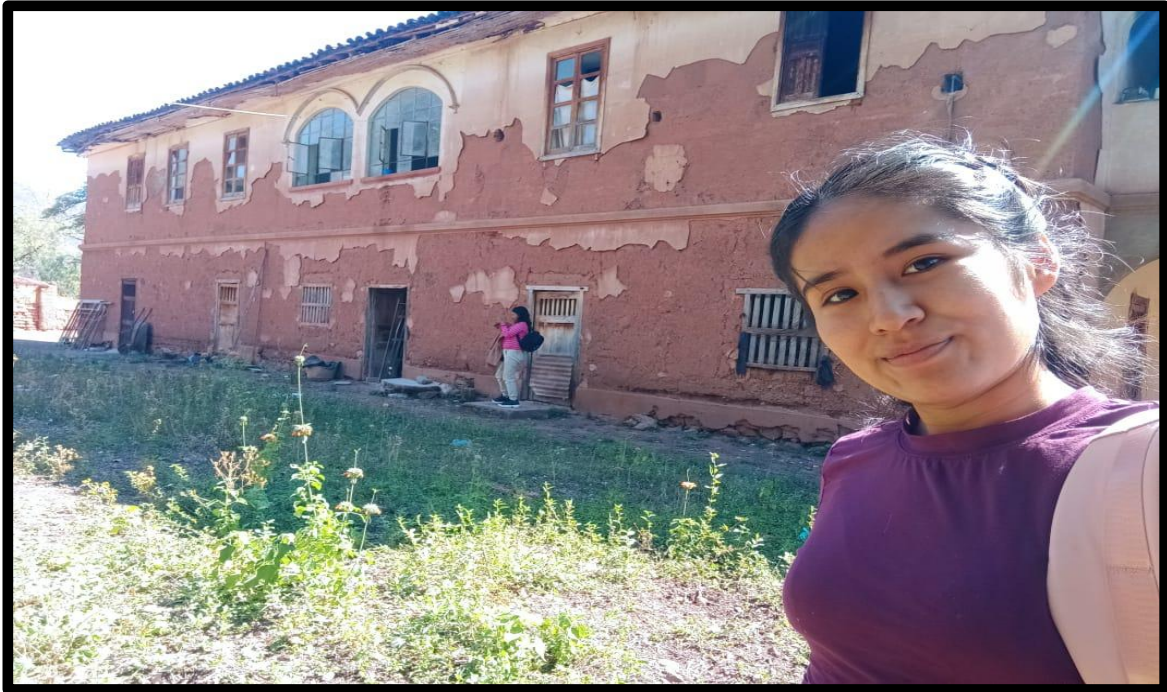
Fotografía N° 15: Casa hacienda de Magnupampa