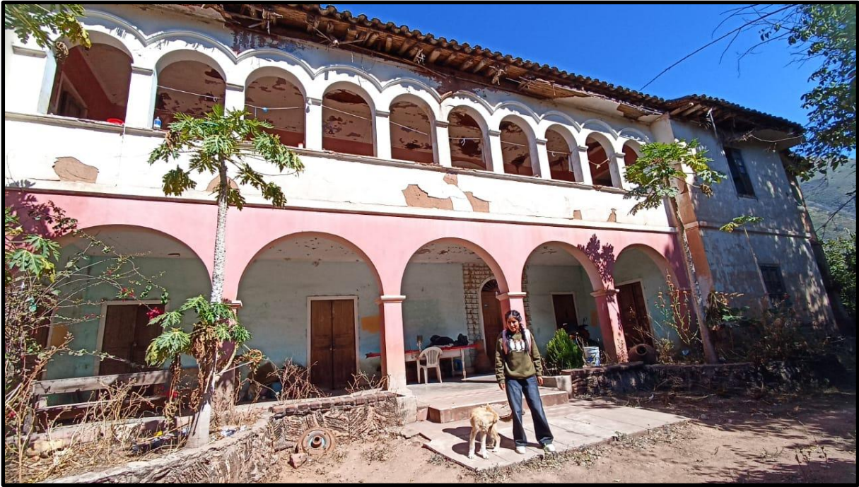
Fotografía N° 9: Casa hacienda de Magnupampa