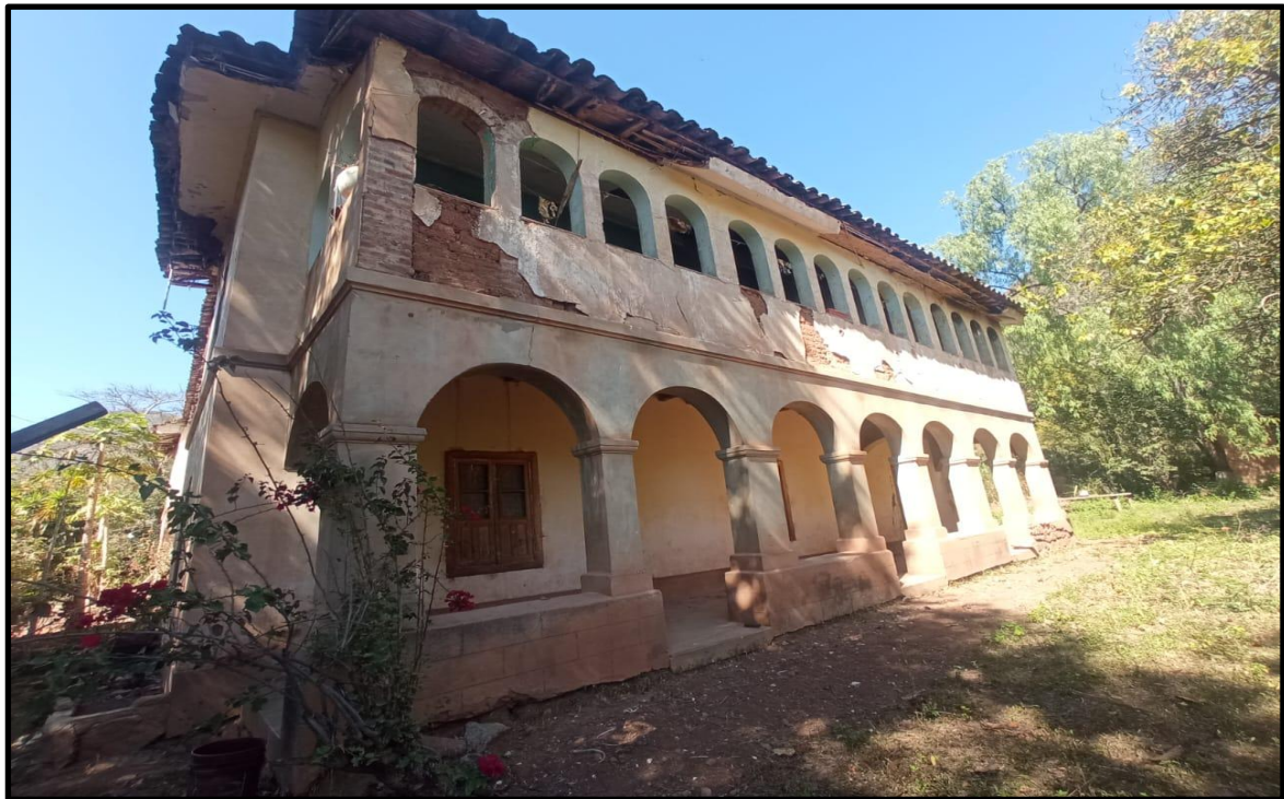
Fotografía N° 12: Casa hacienda de Magnupampa