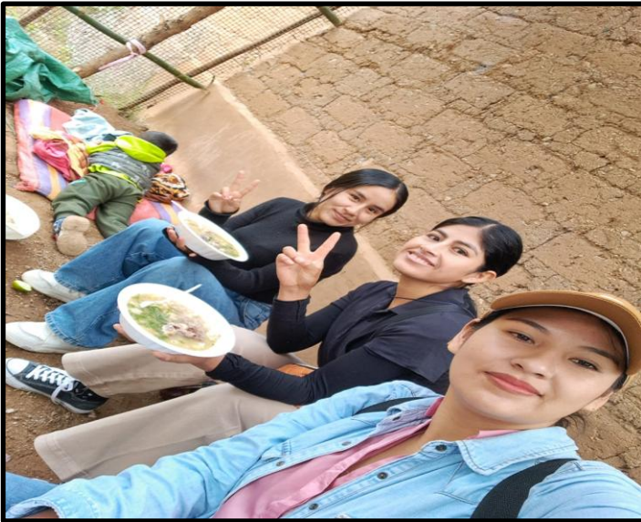
Fotografía N° 7: Compartiendo en la comunidad