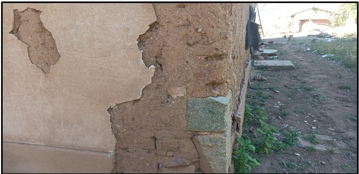
Fotografía N° 16: Infraestructura en estado de deterioro