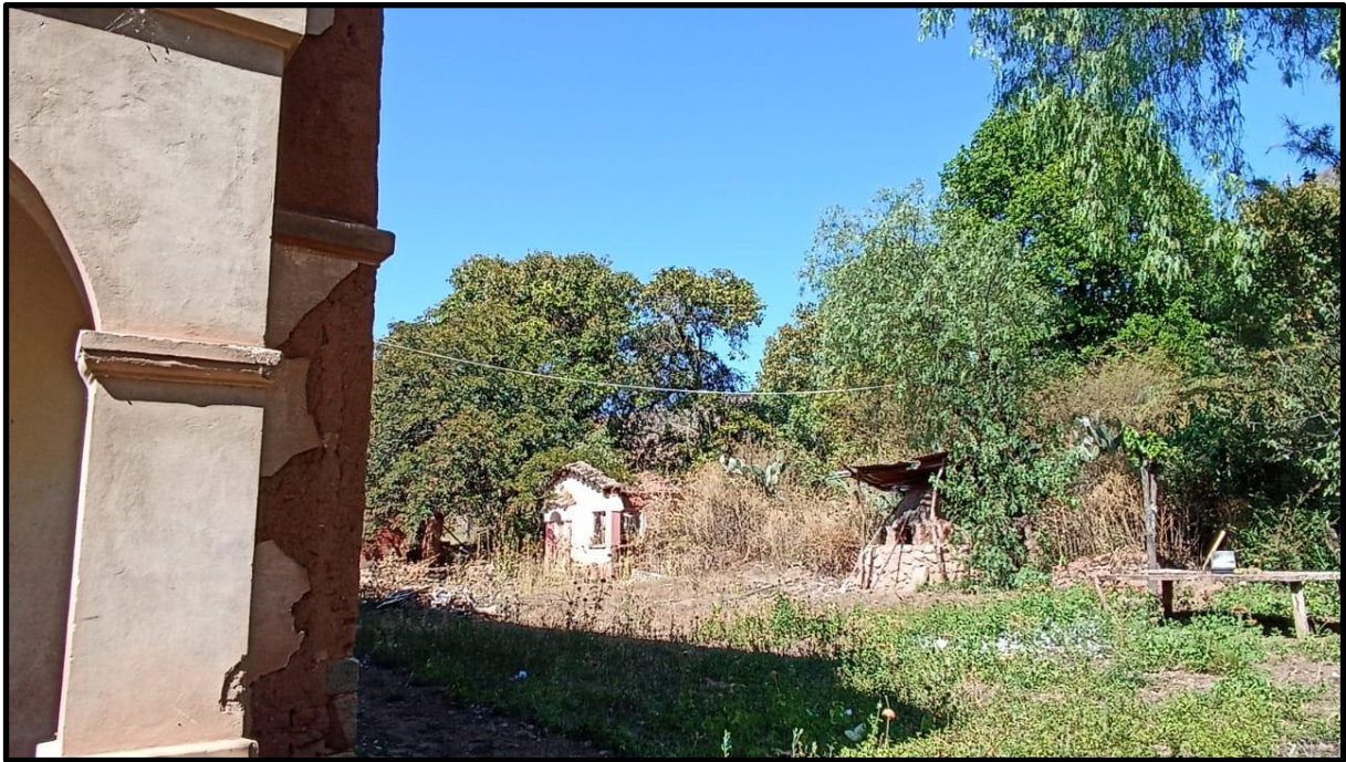
Fotografía N° 23: La antigua iglesia perteneciente a la casa hacienda