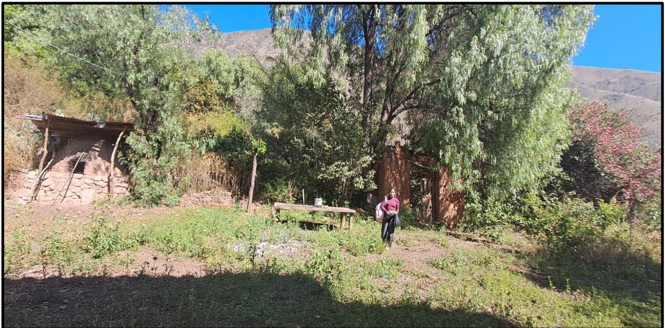
Fotografía N° 22: Antigua entrada a la casa hacienda