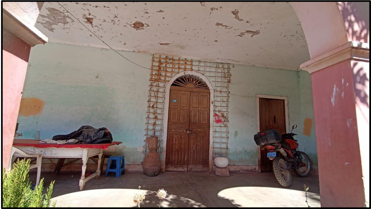
Fotografía N° 19: Casa hacienda de Magnupampa