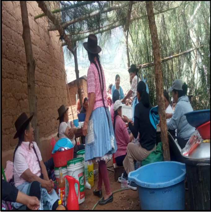
Fotografía N° 5: Conviviendo con las personas de la comunidad de Magnupampa