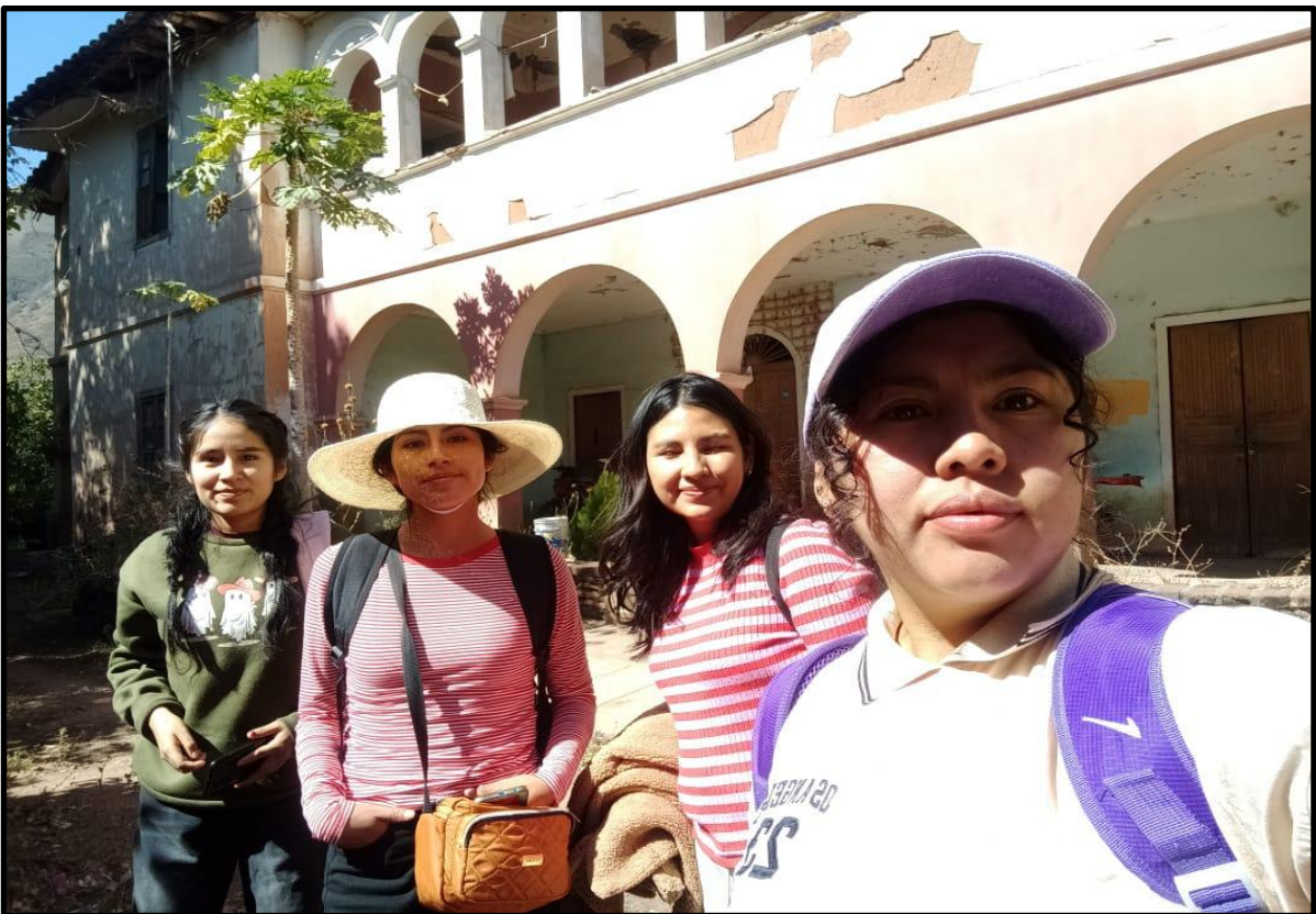
Fotografía N° 24: Casa hacienda de Magnupampa