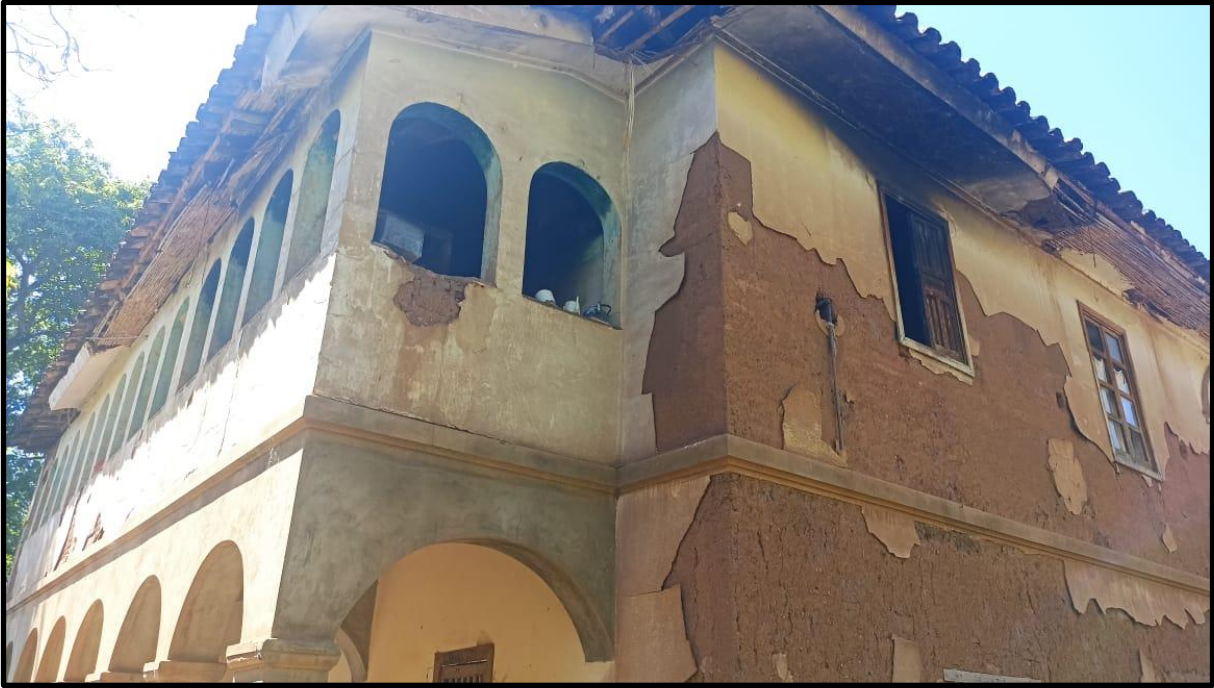
Fotografía N° 17: Casa hacienda de Magnupampa