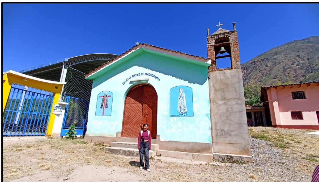
Fotografía N° 26: Iglesia de Magnupampa