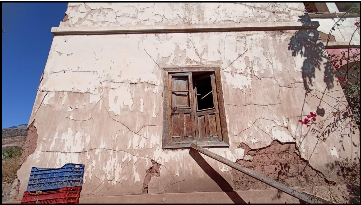
Fotografía N° 18: Casa hacienda de Magnupampa