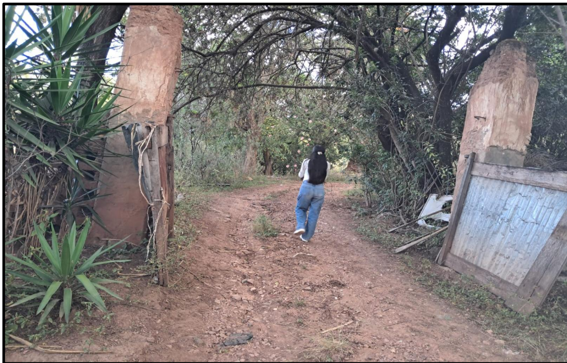
Fotografía N° 25: Entrada principal a la casa hacienda de Magnupampa